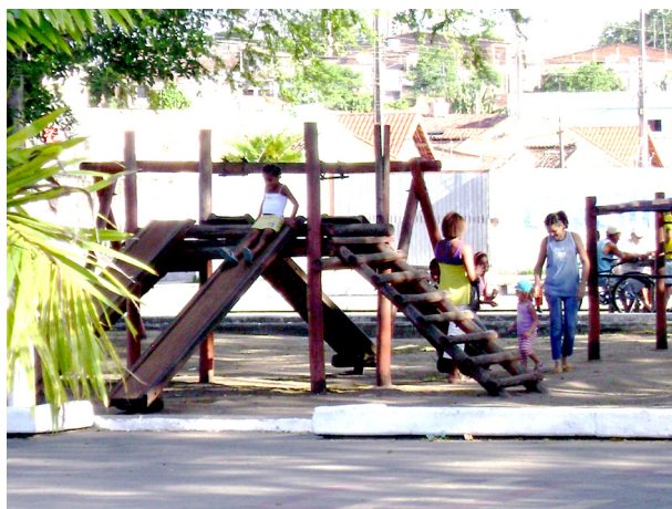
Imagem 03: Praça Joana D'Arc – playground

As praças, as ruas e a quadra são apontadas pelos moradores como necessitadas de manutenção e segurança, pois crianças e jovens brincam, nestes espaços, que se encontram depredados. Na maior praça do bairro, Praça Joana D'Arc, encontra-se um playground, em que as crianças brincam no escorregador, pois os outros equipamentos, como a gangorra e os balanços estão quebrados por falta de manutenção.